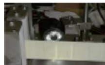
■パターンマッチングセンサー（オプション） （ラベルの誤字・脱字を認識するものではありません。）